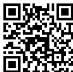
北大未来技术学院 微信公众号