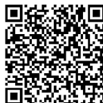
北大未来技术学院 工程博士官网